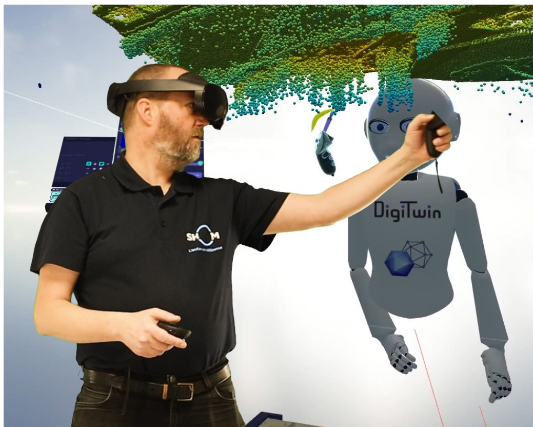
Traitement collaboratif en réalité virtuelle - Shom x Cervval

Au Shom, l'acquisition de la donnée se fait par moyens acoustiques (sondeur multifaisceaux) ou par moyens optiques - systèmes laser aéroportés, appelés LiDAR. Les ondes ou la lumière émises se réfléchissant sur les fonds marins, il est ainsi possible d'en déduire la profondeur de l'océan ou les reliefs du littoral.